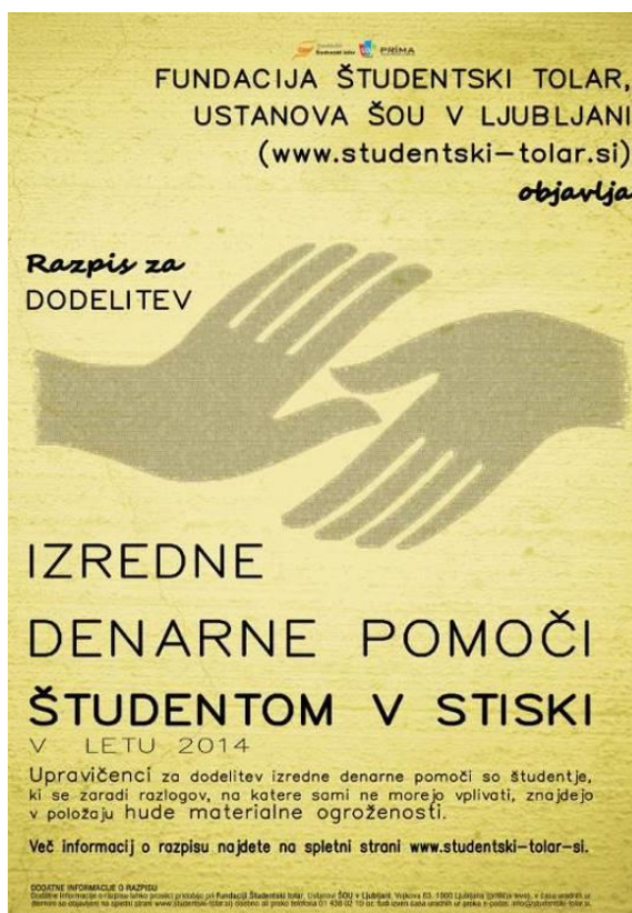
Sliki 9 in 10: Plakat za promocijo razpisov za nepovratne denarne pomoči iz leta 2018 (levo) in 2014 (desno).

Rezultati razpisov iz leta 2019 so podobni s preteklimi, a precej boljši od minulega leta. Namreč v 2019 smo dodelili bistveno več denarnih pomoči kot leto prej, in sicer 208, kar je 40 % več kot v letu 2018. Sicer smo v 2019 tudi objavili en razpis več, kot v letu prej, kar gre povečanju števila vlog morda delno pripisati tudi temu, delno bi lahko pripisali tudi temu, da smo se v 2019 več oglaševali – predvsem na Facebooku ter novem kanalu Instagram, v oktobru in novembru 2019 pa smo z zunanjim izvajalcem, ki nam je pripravil tudi komunikacijski načrt, izvedli več promocijskih akcij tudi po članicah ŠOU v Ljubljani in na Študentskem kampusu.