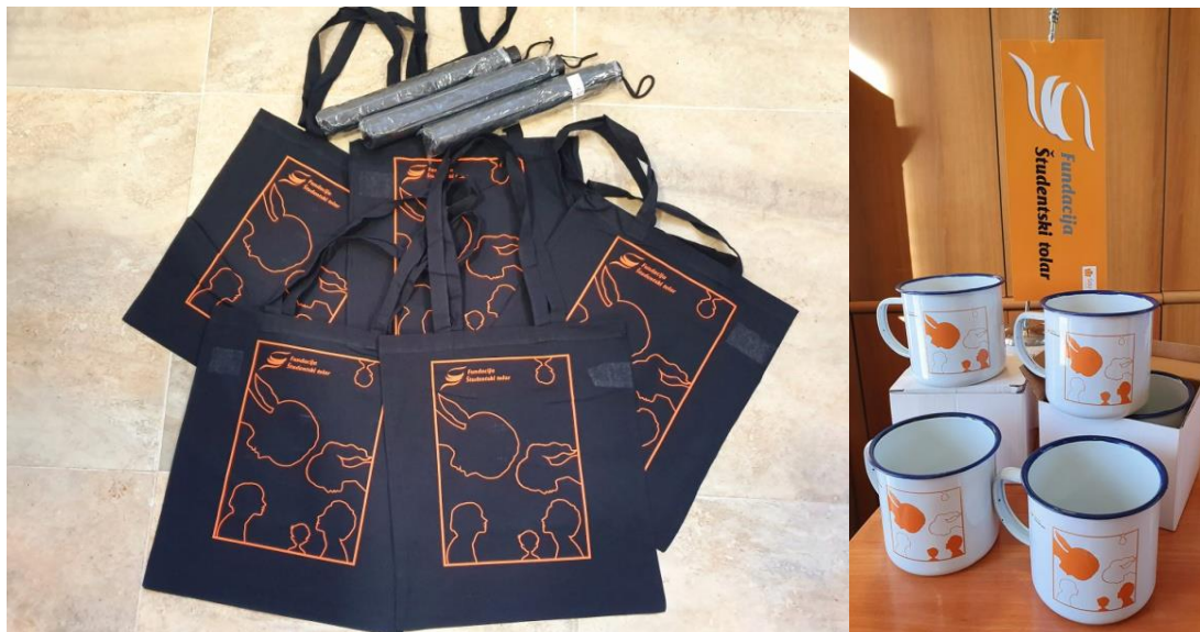
Sliki 6 in 7: Promocijski material Fundacije Študentski tolar, izdelan v letu 2019.

Čez leto svoje pretekle udeležence obveščamo o svojih programih tudi preko elektronske pošte, redno pa pri objavah začetkov programov sodelujemo z različnimi mediji, ki poročajo o naših dejavnostih. O naših dejavnostih poroča tudi naš ustanovitelj preko svoje elektronske baze (ŠOU informator s preko 40.000 elektronskimi prejemniki), spletne strani in družbenih omrežij. Medijsko smo bili kar uspešni. O posameznih razpisih smo podali medijsko izjavo, ki je bila dobro povzeta v mnogih dnevnih medijih, tiskanih, radijskih in elektronskih.