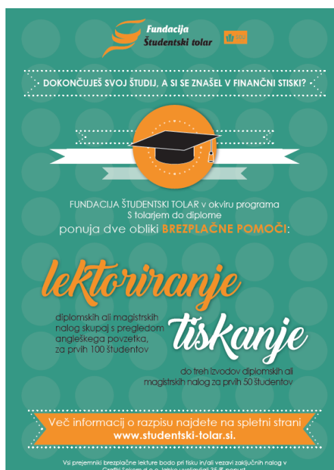
Slika 11: Plakat za promocijo programa S Tolarjem do diplome.

V okviru projekta S Tolarjem do diplome študentom v socialni stiski omogočamo brezplačno lektoriranje diplomskih in magistrskih del ob zaključku 1. ali 2. stopnje, brezplačen pregled povzetka del v angleškem jeziku in pa brezplačen črno-beli tisk (printanje) teh del. Hkrati pa s projektom ponujamo študentom slovenistike Filozofske fakultete Univerze v Ljubljani oziroma mladim diplomantom dodatne izkušnje na področju njihovega študija, s tem ko opravljajo to delo za nas.