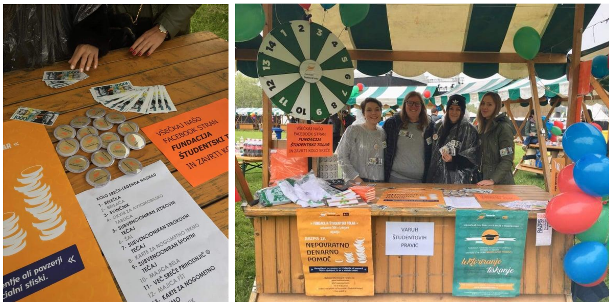
Sliki 14 in 15: Ekipa Fundacije Študentski tolar na Škisovi tržnici 2019.

Tudi v 2019 smo za promocijo poskrbeli tudi z aktivno udeležbo na različnih študentskih dogodkih. S stojnico smo se poleg na Škisovi tržnici, kjer smo prisotni vsa leta od ustanovitve, predstavljali na sejmu Arena mladih, ki je potekal 25. in 26. januarja 2019 na Gospodarskem razstavišču. Septembra 2019 smo se na Bregu ob Ljubljani promovirali na 18. Vseslovenskem festivalu nevladnih organizacij Lupa 2019. Prva dva tedna oktobra 2019 smo se s stojnico predstavljali na Študentskem Kampusu, maja pa tudi na nekaj prireditvah v okviru Majskih iger.