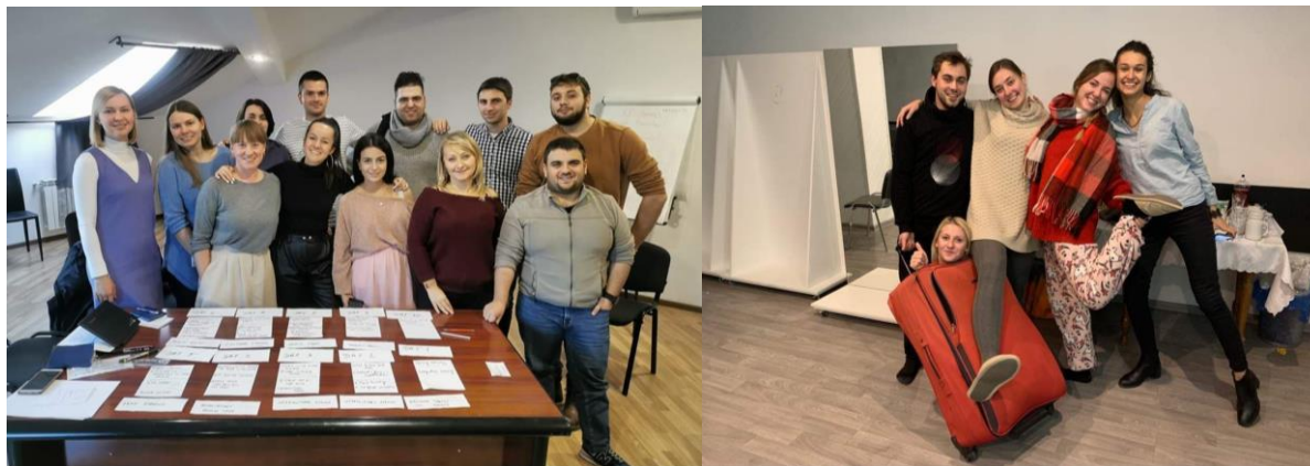
Sliki 12 in 13: Ekipa Fundacije Študentski tolar na pripravljalnem obisku projekta »Youth Media Forum« v Rusiji (levo) in del naših študentov na projektu " It is all about Communication and Dialogue" na Poljskem (desno).

V letu 2015 smo začeli sodelovati v okviru programov Erasmus+ za mlade, kjer želimo ali izobraževati lasten kader o področju dela, ki ga opravljamo, in pa mladim omogočiti pridobitev izkušenj in znanj z udeležbo na projektih tega evropskega programa. V programu nastopamo samostojno ali pa skupaj s ŠOU v Ljubljani, kjer v večini mi prevzamemo koordinacijo dela tudi za ŠOU v Ljubljani. Skupaj smo bili v letu 2019 vključeni v 8 projektov, nekaterih z več aktivnostmi, od katerih jih je večina predstavljala mladinske izmenjave. V projekte smo vključili 37 slovenskih študentov ali dijakov in dva naša predstavnika.