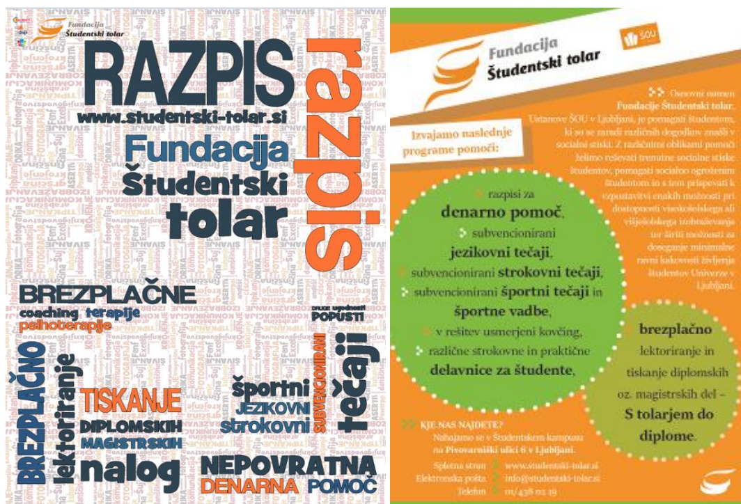
Sliki 1 in 2: Promocijski plakat (levo) in letak (desno) o dejavnostih Fundacije Študentski tolar.

V letu 2019 je bilo v dejavnosti Fundacije vključenih 678 mladih. Omogočenih in že izvedenih je bilo 230 denarnih pomoči in 212 subvencioniranih tečajev.