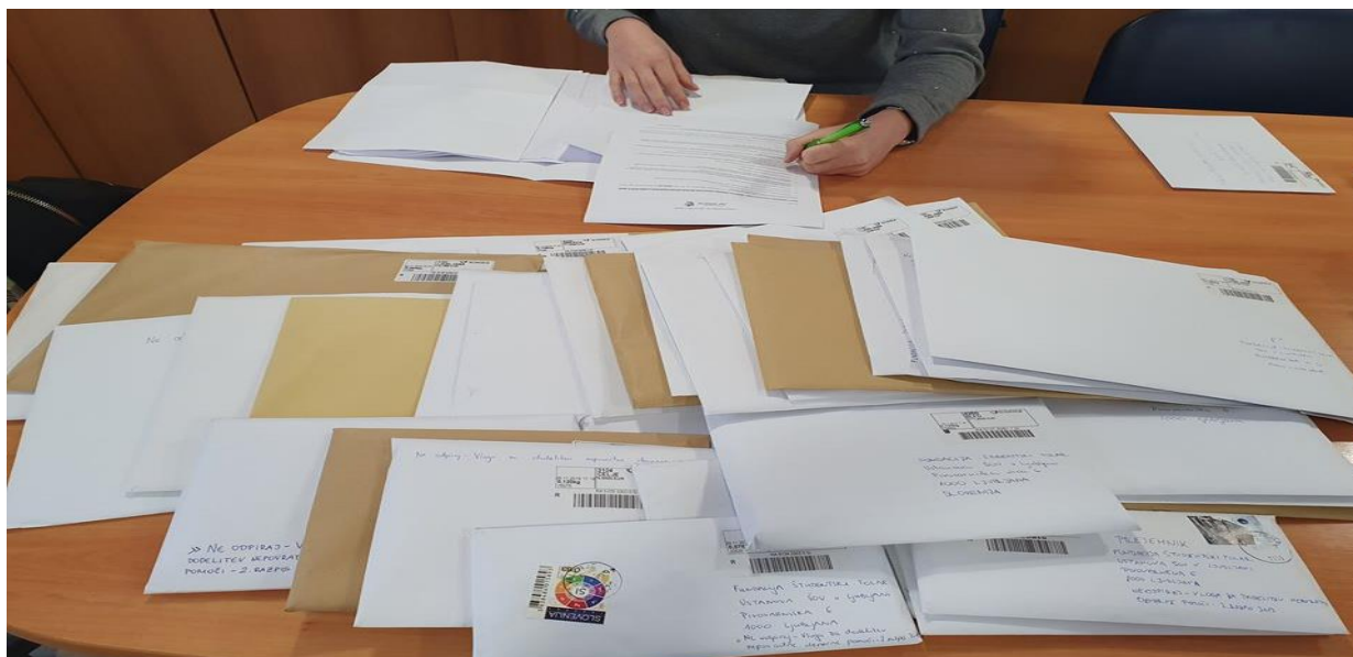
Slika 3: Prejeta pošta za nepovratne denarne pomoči.

Akt o ustanovitvi je naš ustanovitelj sprejel leta 2004, dokončno pa je bila fundacija ustanovljena leta 2006. Od časa ustanovitve dalje fundacija kontinuirano na tedenski ravni čez večino leta izvaja programe za mlade. Programe izvajamo v rednih terminih. Fundacija z izvajanjem svojega namena izvaja dejavnosti oz. programe, opisane v nadaljevanju, katerih namen je zagotavljanje boljših pogojev za življenje, delovanje in organiziranost mladih v socialni stiski. V programe fundacije je letno vključenih večje število mladih - npr. v letu 2014 smo aktivno vključili 812 udeležencev, leto poprej 997, v letu 2016 589 mladih, v 2017 777 mladih, v letu 2018 597 in v letu 2019 678 mladih. Pri tem je treba poudariti, da številke oseb v tem poročilu dejansko predstavljajo število odobrenih vlog študentov in drugih mladih, saj zaradi narave svojega dela v poročanjih ne vodimo študentov poimensko. Obenem pa nam akti tudi določajo v katerih primerih je študent upravičen, da dobi več pomoči v posameznem letu (npr. do največ dve denarni pomoči v zaporednih 12 mesecih).