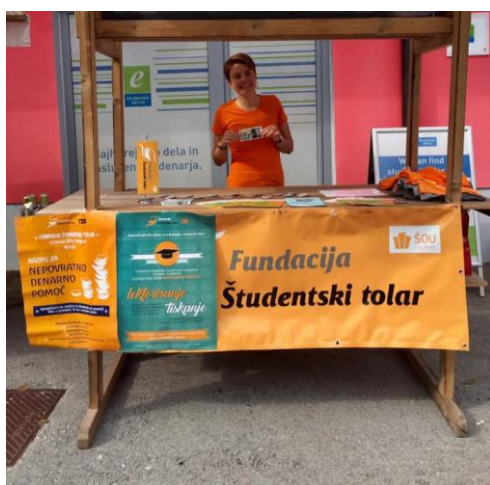
Slika 8: Predstavitvena stojnica ob začetku študijskega leta na Študentskem Kampusu.

Vsi pravilniki, razpisi in relevantne informacije o delovanju Fundacije Študentski tolar so javno dostopni – objavljene najmanj na naši spletni strani. Posamezne vloge in prejemniki naših pomoči pa so zaradi varovanja osebnih podatkov in integritete posameznika javnosti ter nepooblaščenim osebam popolnoma zakriti.