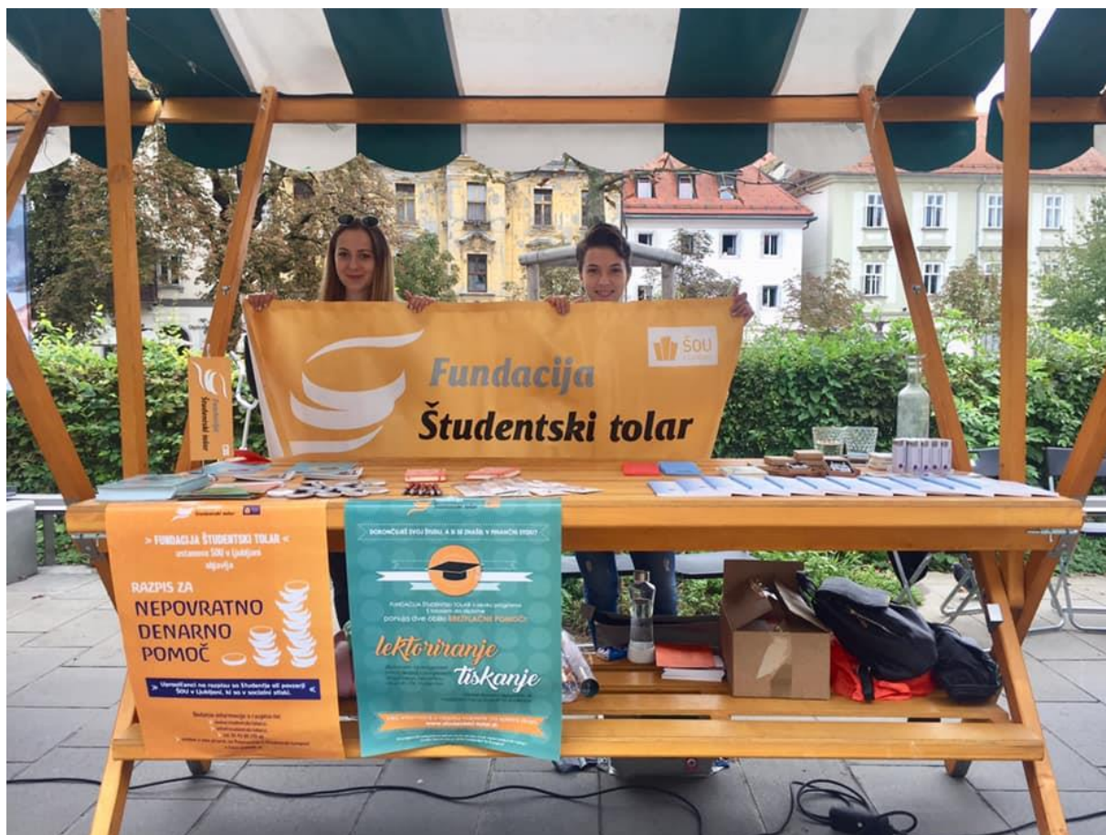
Slika 16: Ekipa Fundacije Študentski tolar na 18. Vseslovenskem festivalu nevladnih organizacij Lupa 2019.