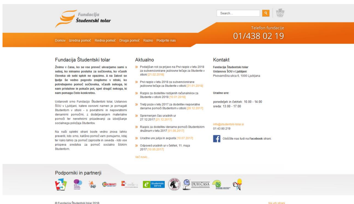
Slika 5: Spletna stran Fundacije Študentski tolar.

Na naši spletni strani http://www.studentski-tolar.si lahko zainteresirani vedno preverijo, kdo smo, kakšno pomoč ponujamo, kdaj ter kako lahko študenti za pomoč zaprosijo. Naši cilji in pogoji, ki jim morajo prosilci ustrezati za pridobitev pomoči, so, skupaj s točkovnimi, objavljeni na naši spletni strani. Programe izvajamo kontinuirano skozi celo leto, nekaj dejavnosti pa je omejenih za določen čas v okviru koledarskega leta.